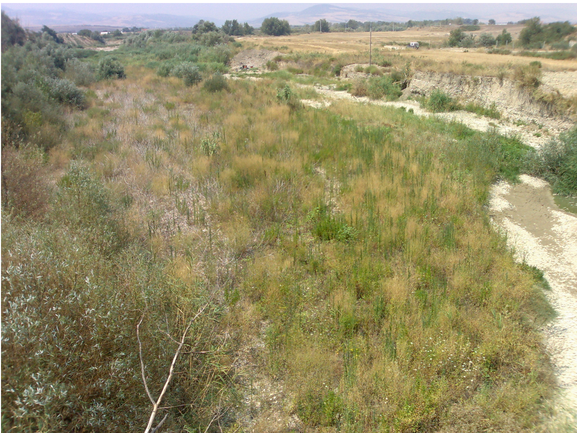
Foto 2. Alveo del Cervaro, vista verso monte (località I Vignali, presso regio tratturello n.35)