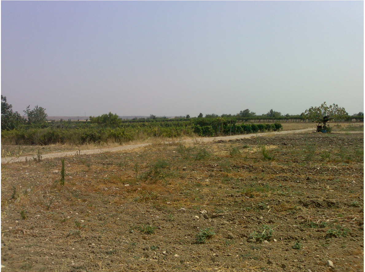
Foto 7. Aree coltivate presso tratturello n.35