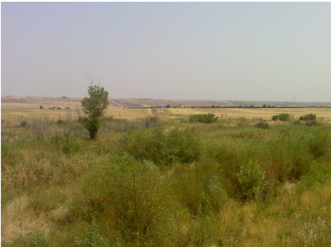
Foto 6. Vista dell'area SIC verso Troia/Foggia (presso tratturello n.35)