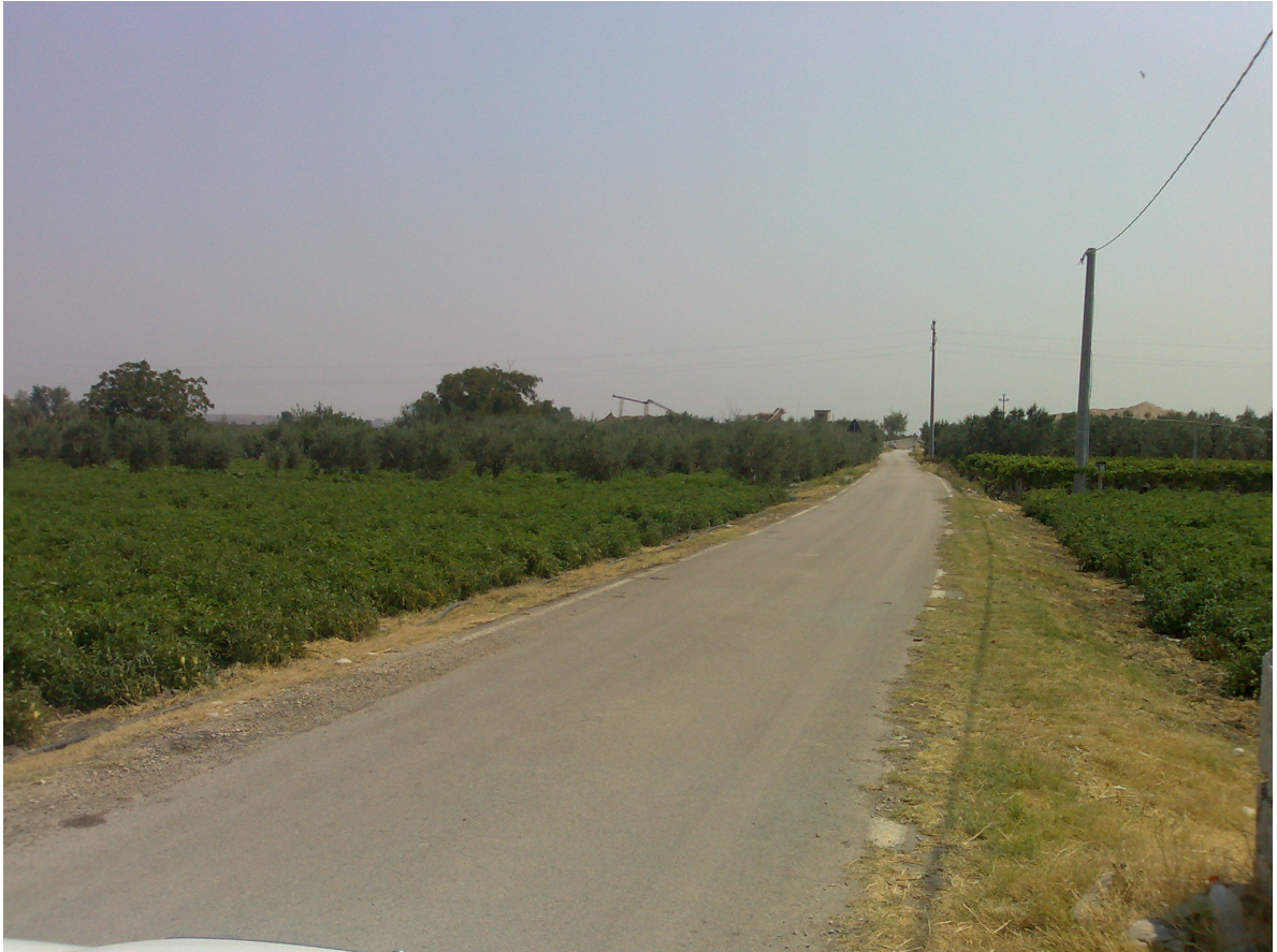
Foto 9. SIC presso regio tratturello n.35