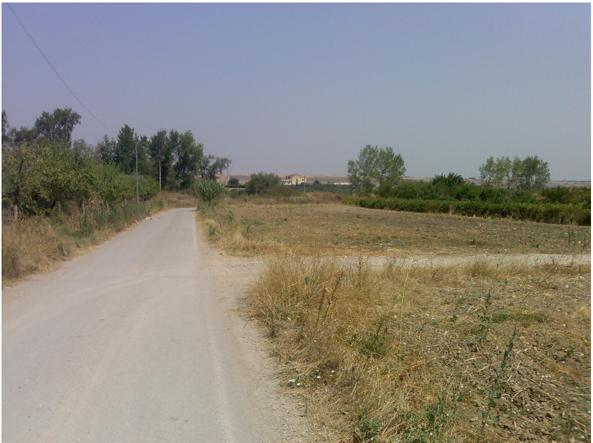
Foto 8. Regio tratturello n.35, area SIC