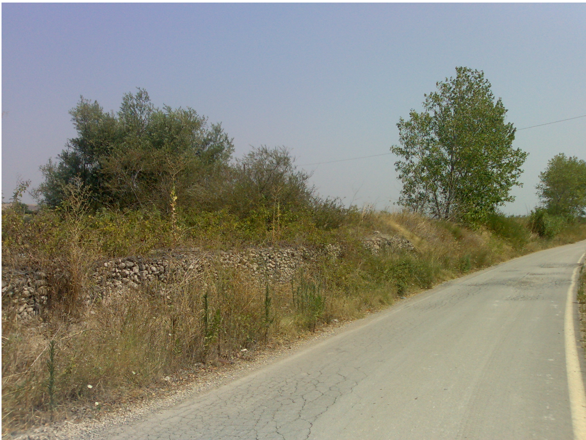
Foto 4. tratto di strada asfaltata nelle vicinanze del tratturo n.35 (presso sponda destra torrente Cervaro, vicino impianto di frantumazione)