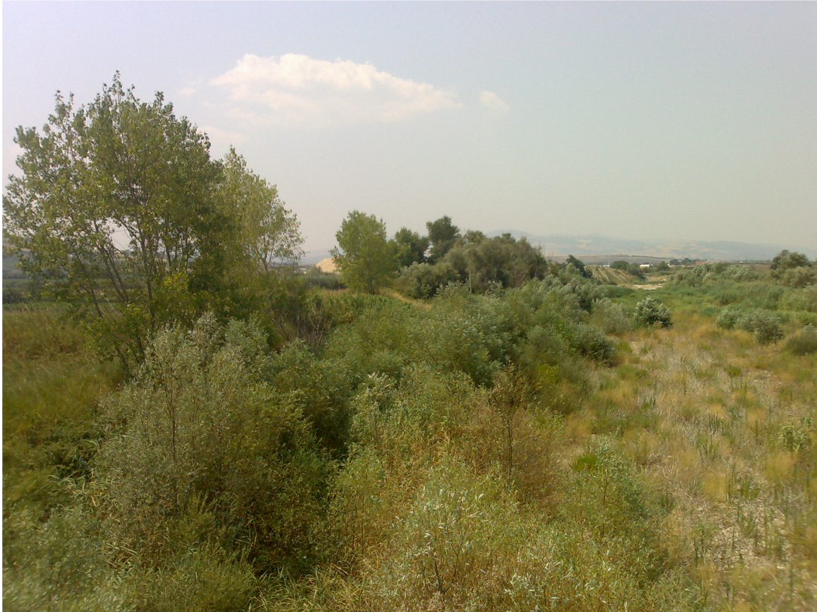
Foto 3. SIC presso regio tratturello n.35 "Castelluccio - Foggia" (località I Vignali)