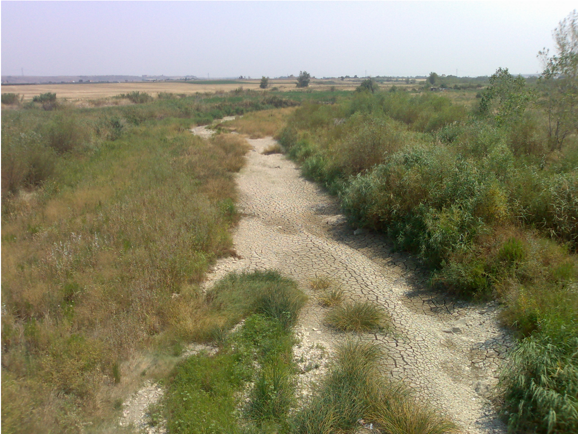
Foto 1. Alveo del Cervaro, vista verso valle (località I Vignali, presso regio tratturello n.35)