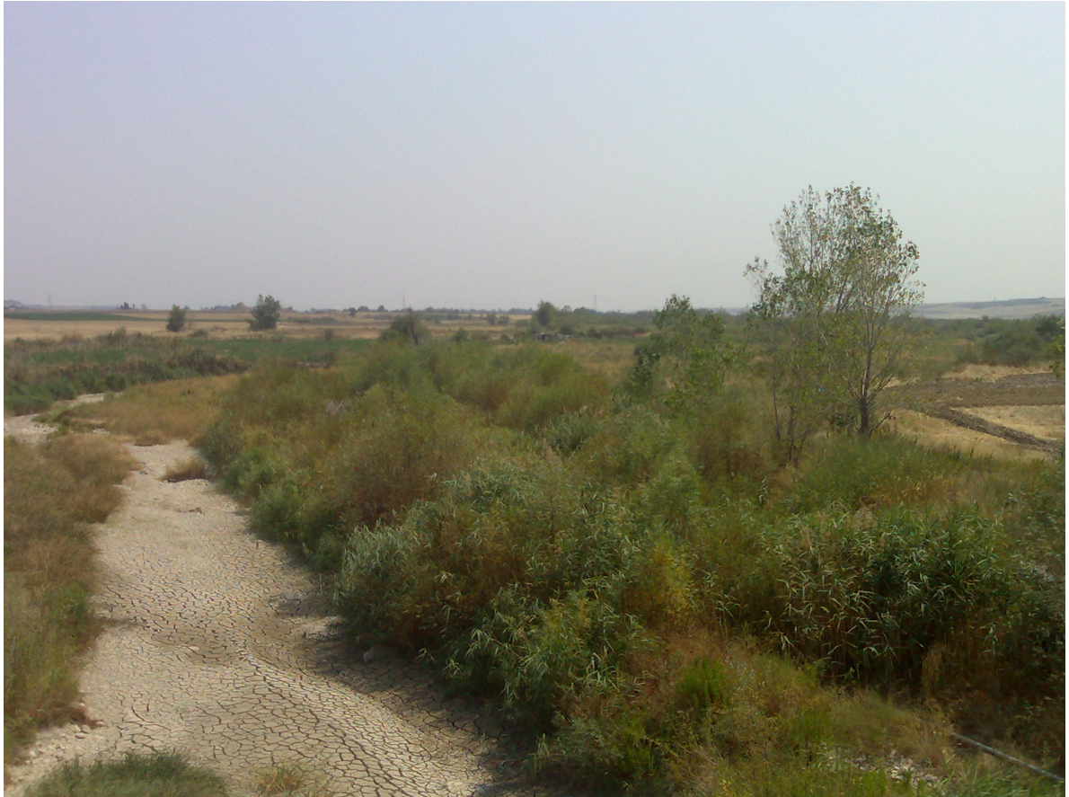
Foto 11. Alveo del Cervaro e vegetazione perifluviale, vista verso valle (località I Vignali, presso regio tratturello n.35)

La documentazione fotografica riportata costituisce un'integrazione della relazione e delle tavole allegate.